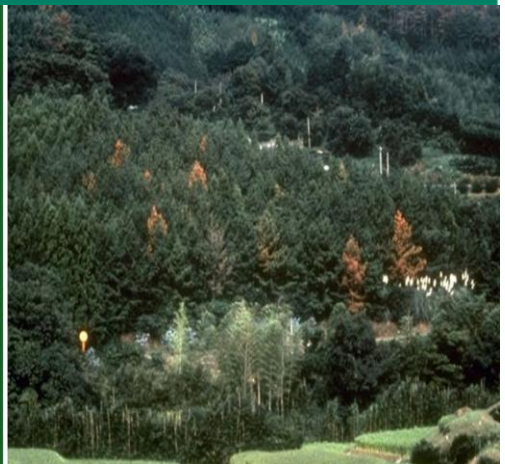
Fig. 3: Skov angrebet af fyrrevednematoden. Den spredes ofte til nye områder med træemballage