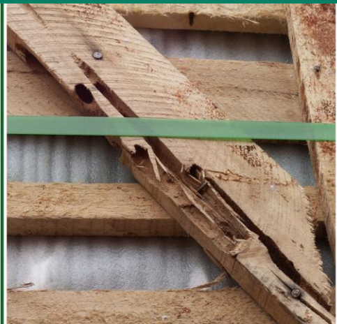
Fig.2: Emballage med galerier efter larver af asiatisk træbuk