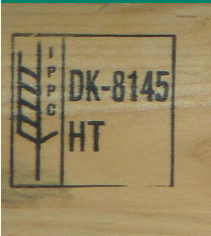
Fig. 1: Træemballage fra Danmark med ISPM-15 mærke